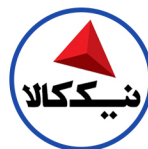
شرکت تولیدی و صنعتی نیک کالا