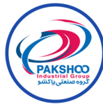
گروه صنعتی پاکشو